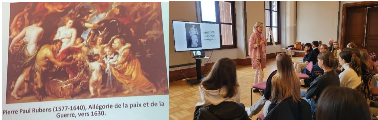
Pierre Paul Rubens (1577-1640), Allégorie de la paix et de la Guerre, vers 1630.