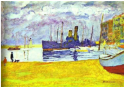
Le Port de Cannes, 1927

En 1893, il rencontre Maria Boursin, par hasard à Paris et leur attirance est immédiate. Celle-ci se présente à lui sous le nom de Marthe de Méligny et prétend descendre d'une famille de l'aristocratie italienne. Elle est en réalité vendeuse dans un commerce de fleurs artificielles et vient d'une famille modeste. Peu importe cette petite cachoterie, elle devient immédiatement la muse du peintre et inspire ses innombrables nus. A travers ses tableaux, Bonnard dévoile crûment et naturellement leur intimité.