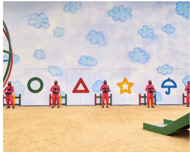
Des jeux d'enfants sanglants

Il y a de tout, un personnage principal attachant, un jeune homme étranger, d'une gentillesse excessive, une fille solitaire, un homme prêt à tout pour se sortir de là, et un homme que la vieillesse a rattrapé... Cette série de 9 épisodes fait ressortir la ferveur de vivre des êtres humains et montre jusqu'où ils sont prêts à aller pour survivre. On y explore une vision des plus pessimistes et primaires de l'humain.