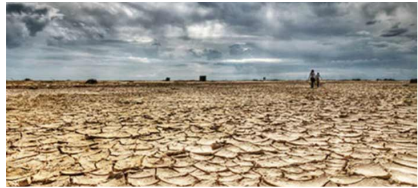
Madagascar touchée par la sécheresse

Pour finir, dans le but d'une amélioration mondiale de la situation, les pays riches doivent aider financièrement les plus pauvres ou ceux en voie de développement, afin de les soutenir dans leur transition écologique. De plus, les pays les plus pauvres ne représentent qu'une faible part des émissions de gaz à effet de serre mais souffrent des mêmes conséquences que ceux qui polluent le plus et ont plus de difficultés à y faire face. Par exemple, la moitié Sud de Madagascar est touchée par une grave famine due à une sécheresse causée par le changement climatique. Ceux qui souffrent le plus sont les habitants des pays pauvres qui font face aux conséquences sans être assez aidés et dont on se désintéresse trop souvent et trop facilement.