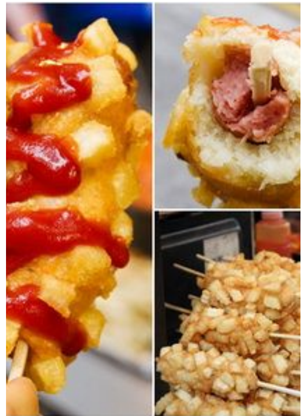
Tokkebi - hot-dog

6 saucisses à hot-dog ou du fromage selon la garniture que vous souhaitez.