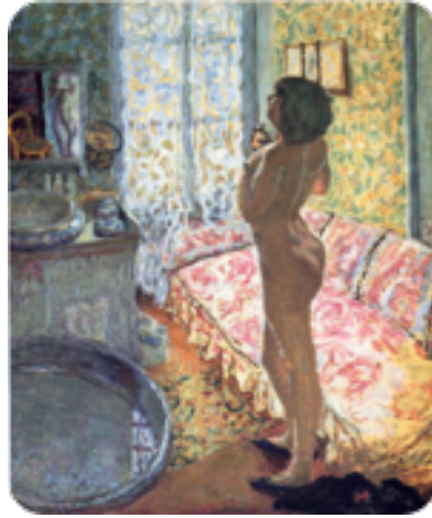
Nu de Marthe, 1908