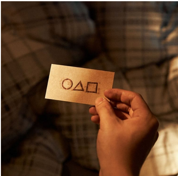
Invitation au jeu du calamar

Au delà de la violence inouïe que nous offre la série, cette dernière cache aussi une véritable volonté de dénoncer les maux de la société coréenne : des gens criblés de dettes qui ne trouvent plus que la mafia pour tenter de les aider.