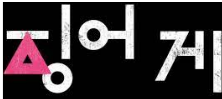
Le principe d'un monde déshumanisé

Une série dénonçant la société coréenne mais pas seulement, au-delà de la Corée, c'est la société du monde qui est dénoncée. C'est ce qui a attiré autant de téléspectateurs différents, en plus d'un aspect psychologique parfaitement traité, ainsi qu'un aspect graphique et cinématographique plus que réussi.