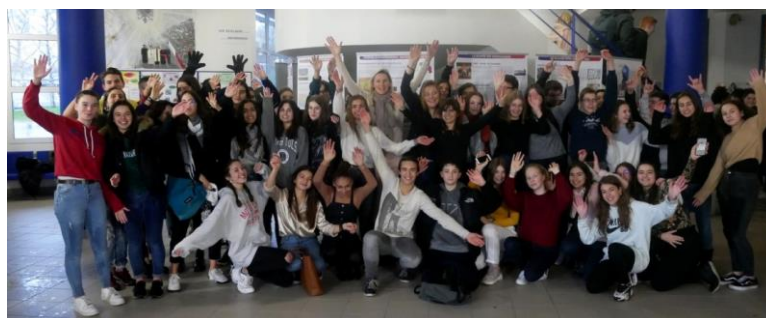
Visite guidée offerte pour les correspondants catalans.

[Voir Annexes N° 12 : Article DNA, 20/12/2019]