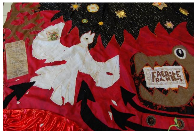
La colombe blessée qui « s'extrait » des flammes et des flèches de la guerre et qui échappe au crocodile qui broie la fraternité.

*Les idées que cette tenture véhicule. Il est possible, de travailler ensemble, de vivre des temps joyeux et constructifs ensemble. Il est possible de réussir ensemble une œuvre belle que chacun peut s'approprier. La multiplicité des prénoms inscrits sur les morceaux de chemins en témoigne et interpelle. La diversité des récits et des images cousues raconte la fraternité, mais les petits bouts de textiles assemblés racontent aussi que la richesse de la fraternité partagée est universelle. Ce qui est essentiel, ce n'est pas tant les différences que le partage. Le fait qu'un jeune adulte aveugle s'exclame : « Oh, que c'est beau ! », ou qu'une petite fille de 8 ans de l'aire des gens du voyage, dise : « merci de venir nous permettre de faire ça », fait réaliser que là est l'essentiel. C'est finalement un trésor que nous avons découvert : comprendre que les chemins et les routes des hommes puissent être différents les uns des autres, tout en pouvant cohabiter, et qu'ils ne sont jamais terminés, ni fermés.