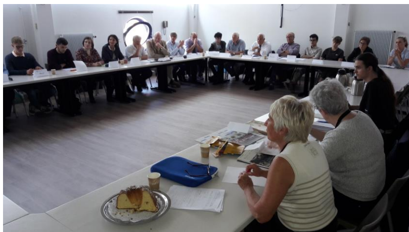
Présentation du Projet « Paix et Fraternité » au Lycée Camille Sée.

*Mercredi 18. 09. 2019 : réunion de travail lors de la journée des parrains-marraines et filleul(e)s de la Fondation « Un avenir ensemble » à Colmar.