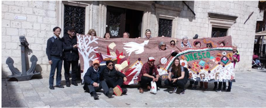
Le groupe à Kotor : des locaux et des touristes se joignent à nous.

Le cas particulier des Balkans , proche historiquement et géographiquement, constituera un terrain d'exploration privilégié pour mettre en lumière les facteurs qui conduisent soit à la paix, soit à la guerre. A partir de cet exemple ciblé, les jeunes seront amenés à élargir leurs analyses , et à prendre conscience que la construction européenne s'est faite pour préserver les valeurs démocratiques et la paix sur le continent .