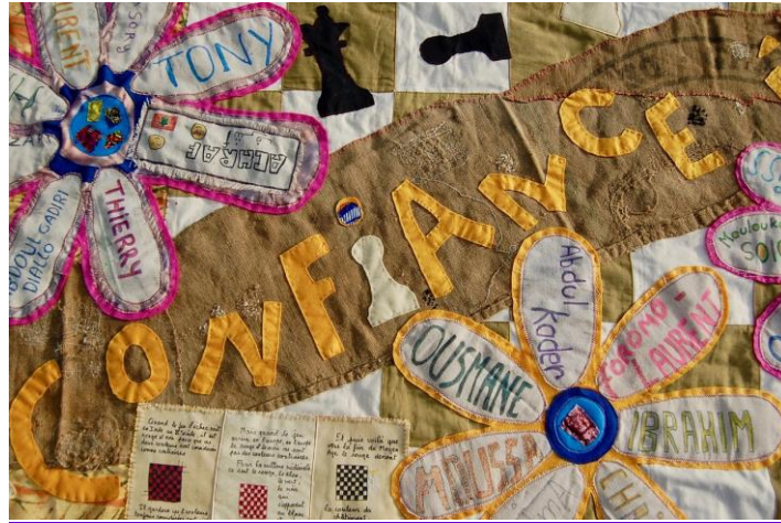
Morceau des chemins « Osez faire confiance à l'autre », réalisé avec 32 jeunes réfugiés l'été 2018.

*Les idées que cette tenture véhicule. Il est possible, de travailler ensemble, de vivre des temps joyeux et constructifs ensemble. Il est possible de réussir ensemble une œuvre belle que chacun peut s'approprier. La multiplicité des prénoms inscrits sur les morceaux de chemins en témoigne et interpelle. La diversité des récits et des images cousues raconte la fraternité, mais les petits bouts de textiles assemblés racontent aussi que la richesse de la fraternité partagée est universelle. Ce qui est essentiel, ce n'est pas tant les différences que le partage. Le fait qu'un jeune adulte aveugle s'exclame : « Oh, que c'est beau ! », ou qu'une petite fille de 8 ans de l'aire des gens du voyage, dise : « merci de venir nous permettre de faire ça », fait réaliser que là est l'essentiel. C'est finalement un trésor que nous avons découvert : comprendre que les chemins et les routes des hommes puissent être différents les uns des autres, tout en pouvant cohabiter, et qu'ils ne sont jamais terminés, ni fermés.