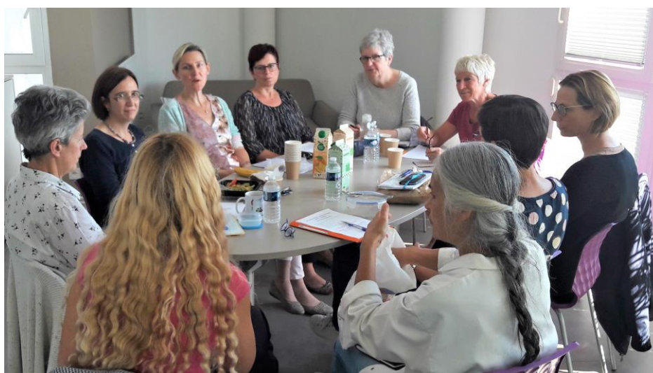
En salle des professeurs au Lycée du Haut-Barr.

*Jeudi 19. 09. 2019 : réunion de présentation et d'organisation du projet avec l'équipe d'enseignantes mobilisées.