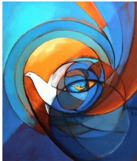
La colombe de la paix de l'ONU de Guy Breniaux