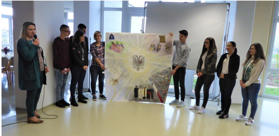
La toile offerte par les élèves de Néhémia à Pogradec (Albanie).

Il ressort de ces témoignages et analyses, que la Bosnie-Herzégovine est encore marquée par les conflits (1992-1995) , avec certaines tensions qui perdurent entre les entités (bosniaques, croates et serbes), ce dont témoignent aussi les paysages urbains (présence récurrente de maisons vides ou calcinées, avec de nombreux impacts de balles ; quartiers séparés où les entités cohabitent sans vivre ensemble), même si des efforts sont menés pour créer un dialogue et du vivre ensemble en paix , en particulier par le Centre international de la paix à Sarajevo, présidé par Monsieur Ibrahim Spahic avec lequel nous avons échangé sur place, et par les directeurs et enseignants des établissements scolaires rencontrés. Concernant l' Albanie , il s'agit d'un pays pacifié, où les différences religieuses et ethniques se vivent de manière fraternelle, même si ce pays de la tolérance est par ailleurs sujet à des problématiques de fuite des cerveaux, de corruption et d'infiltration de capitaux étrangers porteurs d'idéologies plus radicalisées, qui invitent à accentuer le processus de démocratisation en cours, particulièrement via l'éducation .